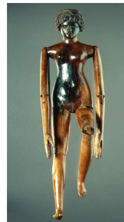
Poupée Creperia Tryphaena