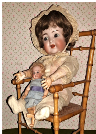
Poupée de caractère