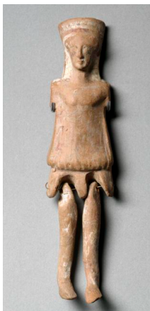
Poupée articulée corinthienne

Enfin, nous avons les poupées romaines . Ces dernières sont construites de trois matériaux différents, soit en os, en bois ou en ivoire. Il s'agit de poupées du IV ème siècle, découvertes dans des tombes et des catacombes. Elles sont représentées de façon dénudées avec la formation de poitrine et d'une incision pour la représentation du sexe. Elle porte des chaussures et parfois quelques accessoires, tels que des vêtements, des bijoux ou mobiliers. L'apparition de poupées en ivoire date, selon les trouvailles, du III ème / IV ème siècle et celles en ébène au II ème siècle.