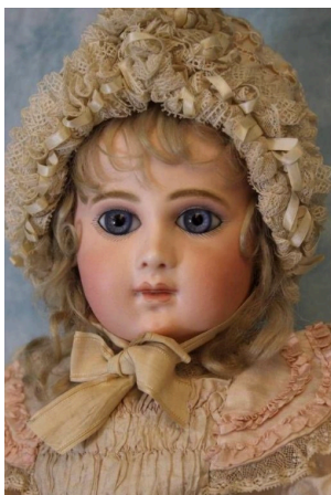
Poupée en porcelaine

Si les poupées étaient fabriquées et sélectionnées avec soin pour les familles modestes, il n'en était guère pour les familles modestes. En effet, pour les familles à petit budget, des poupées bon marché leur étaient proposées. La porcelaine était ainsi remplacée par le mélange de matériaux peu coûteux (pâte à papier, sciure de bois, colle). Elles portaient le nom de “ pouparts ”.