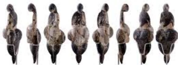
La Vénus de Lespugue

Il est encore difficile de dater l’existence de la première poupée. Si il a été possible de dater des poupées de l’époque paléolithique et néolithique cela n’exclut pas leur existence dans les siècle les précédent. Créées par l’homme, elles pourraient ainsi dater depuis que ce dernier “a été doté d’une activité manuelle et conceptuelle” 5 .